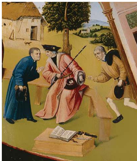
Фрагмент «Алчность» картины Иеронима Босха «Семь смертных грехов»

Рассматривая участников коррупции на примере взяточничества, стоит отметить, что в коррупционном процессе всегда участвуют две стороны. Одна сторона — это взяткополучатель (подкупаемый). Вторая сторона — это взяткодатель (осуществляющий подкуп). Также в процессе может участвовать и третья сторона — посредник.