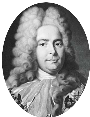
Генерал-прокурор Павел Иванович Ягужинский